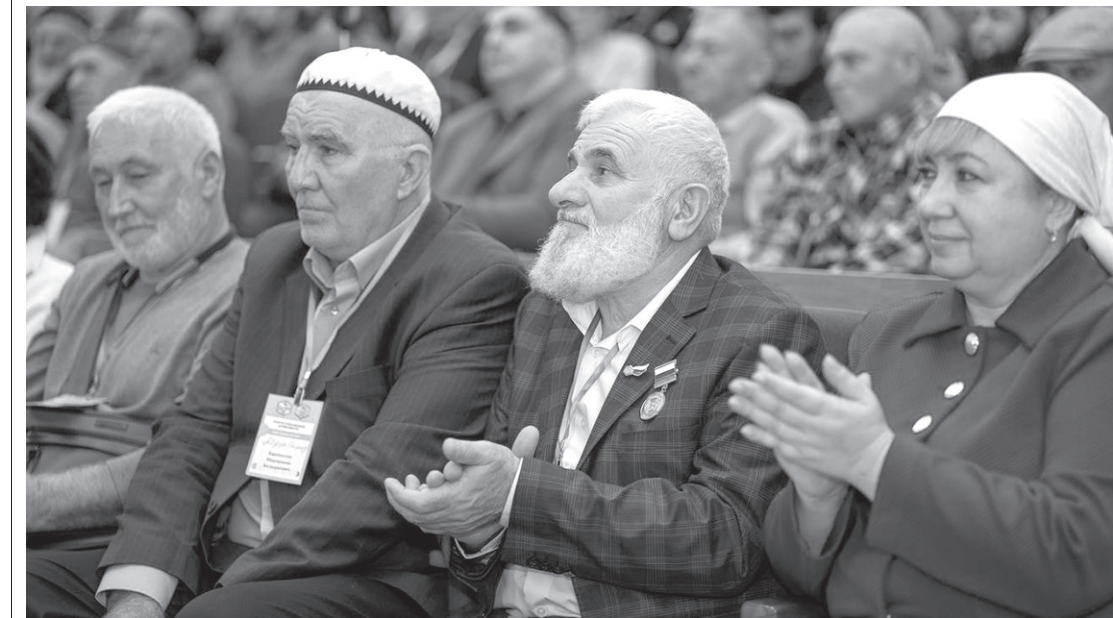
Участники форума пчеловодов внимательно слушали каждое выступление