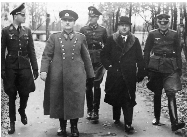
Генерал Турции Эркилет и начальник турецкой военной академии Эрден в ходе визита на Восточный фронт. 31 октября 1941 года

республики не нужны, — писал Исхаков в 1929 г. в статье «О будущем России» — они являются «боячками сепаратизма отдельных племен, раздуваемого красными урусами Москвы». Несмотря на «Договор о дружбе и братстве» между Россией (РСФСР) и Турцией от 16 марта 1921 г., в котором говорилось о недопустимости создания враждебных для сторон участников договора движений, официальные власти не пресекали активности антисоветских деятелей. После смерти Ататюрка (умер в 1938 г.) перед Второй мировой войной правящие круги Турции пошли на фактический союз с гитлеровской Германией. Новый премьер-министр Шюкрю Сараджоглу открыто поощрял пропаганду пантюркизма, а после нападения на СССР гитлеровские правящие круги «использовали пантюркистские устремления для сформирования военных подразделений из советских военнопленных тюркских национальностей», — как отмечали многие западные исследования. Уже осенью 1942 г. Турция сосредоточила на кавказской границе с СССР около полумиллиона солдат, а премьер-министр Турции Сараджоглу в беседе с послом Германии Францем фон Папенom 27 августа 1942 г. заявил, что как турок он страстно желает уничтожить Россию. «Уничтожение России является подвигom Фюрера, равный которому может быть совершен раз в столетие; оно яв-