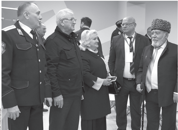
В числе почетных гостей слета — уважаемые люди республики

В Кавказском состоялся межрегиональный слет казачьей молодежи «Наследники»