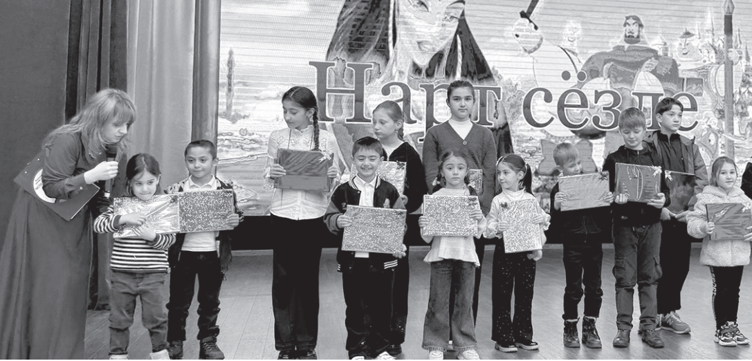
Активные участники викторины на родном языке без призов со сцены не уходят