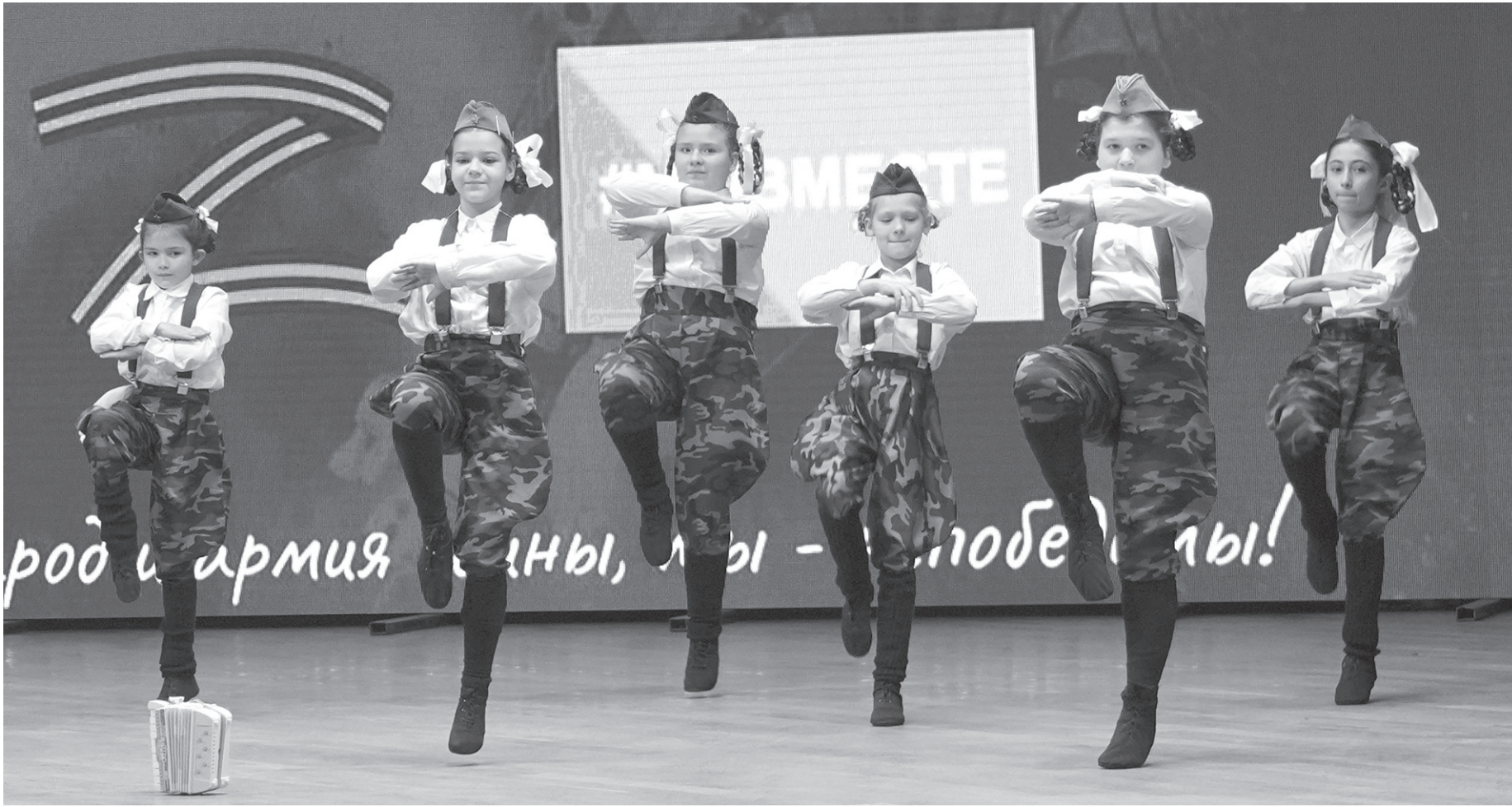
Свои таланты на сцене Дворца культуры продемонстрировали юные звездочки

«Рад видеть, что акция собрала полный зал людей. Сегодня по всей республике, в каждом районном дворце культуры проходят такие концерты. Мы в очередной раз объединились, чтобы поддержать наших бой-